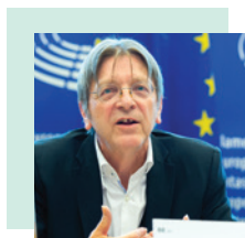
Guy Verhofstadt, zastupnik u Europskom parlamentu

Potporu zajedničkom predsjedništvu pruža izvršni odbor kojim supredsjedaju tri institucije.