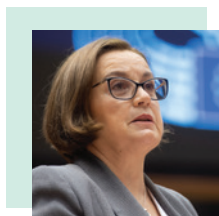
Ana Paula Zacarias, portugalska državna tajnica za poslove EU-a, predstavnica rotirajućeg predsjedništva Vijeća Europske unije