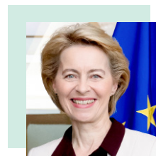
Ursula von der Leyen, predsjednica Europske komisije

koji djeluju u svojstvu zajedničkog predsjedništva .